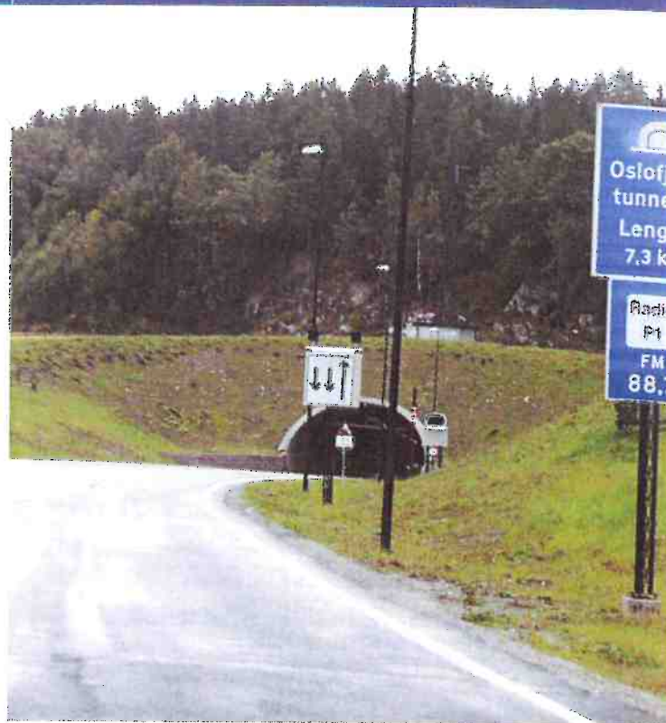
Stengningen av Oslofjordtunnelen viser hvor sårbart et vegsystem kan være, særlig hvis et ikke er brukbare omkjøringsmuligheter.

I beredskapsplanlegging og krisehåndtering snakkes det ofte om årsaksreducerende og skadebegrensende tiltak. Anvendt i forhold til pålitelighet og sårbarhet, der sårbarhet beskriver hvor utsatt vegnettet er for avbrudd,