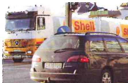
Ny rapport om transport av farlig gods.

Finansieringskilde: Direktoratet for samfunnssikkerhet og beredskap (DSB).