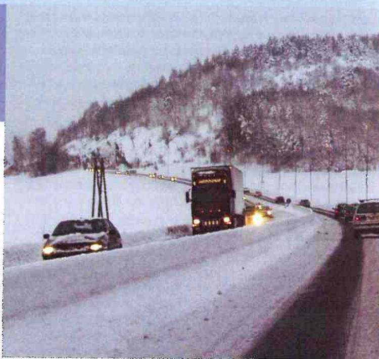
Godt vintervedlikehold reduserer sannsynligheten for kollisjoner og er dermed med på å øke påliteligheten i vegsystemet.

Pålitelighet må være noe mer enn en ren kvantitativ sannsynlighets- beregning av om lenken fungerer eller ikke. At en lenke er til stede betyr ikke nødvendigvis at den kan operere med full kapasitet og pålitelighetsbe- grepet eller sårbarhetsbegrepet må derfor inneholde et element av trafikk- messig brukbarhet eller kjørbarehet for å ha en hensikt. Hvis kjørbarehet defineres som en beskrivelse av hvorvidt (i hvilken grad) det er mulig å bruke en lenke, en veg, en rute, et nettverk til et gitt tidspunkt, vil sårbar- het kunne defineres som et mål på hvor utsatt eller hvor påvirkelig lenken er overfor en betydelig reduksjon i kjørbareheten. Pålitelighet kan da ses på som det motsatte av sårbarhet, nemlig evnen til å opprettholde tilstrekke- lig kjørbarehet i henhold til bestemte operasjonsparametre. En last med fersk fisk på veg fra Ålesund til Oslo vil ha helt andre krav til pålitelighet enn et tilfeldig lass med sand på veg til en tilfeldig byggeplass. Begrepet tilstrekkelig kjørbarehet vil måtte defineres ulikt for ulike typer veger, føre- forhold, kjøretøy, og type transport. Kjørbarehet om vinteren er ikke det